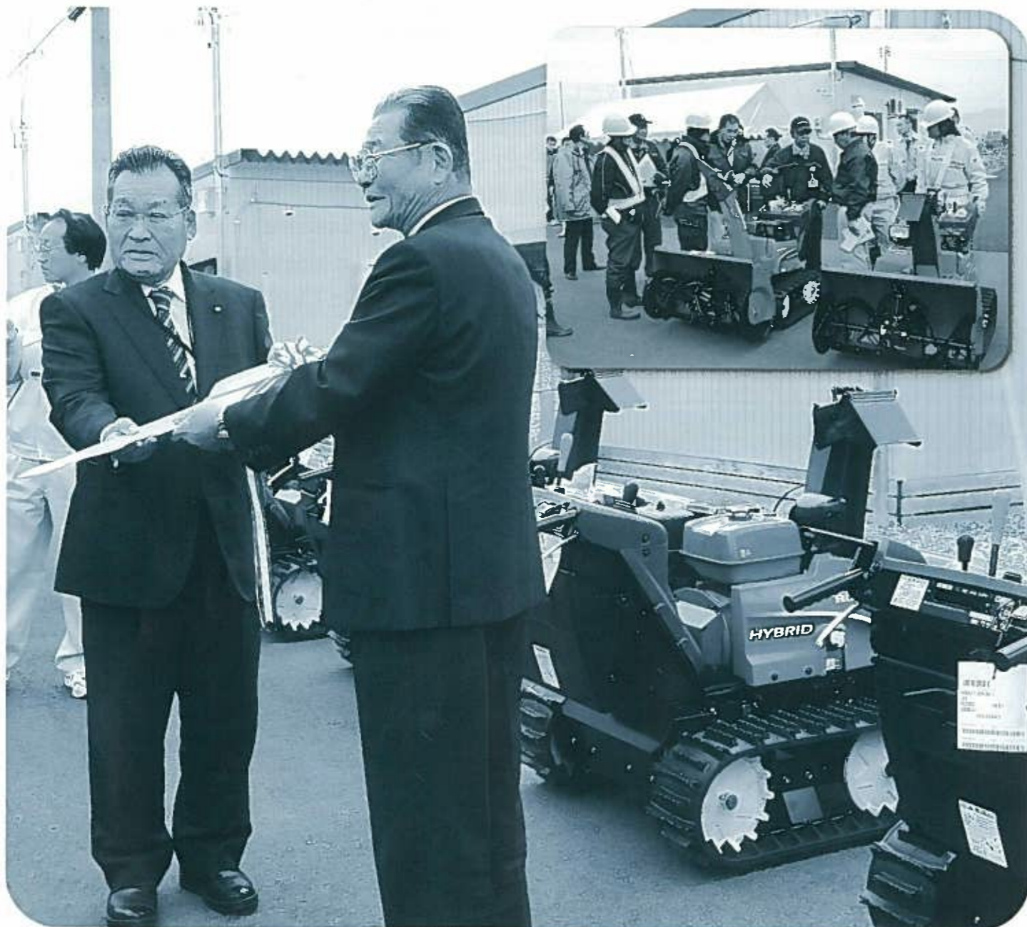
〈小型除雪機配置式にて〉