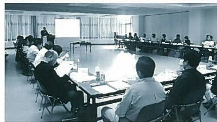
10月16日に開催された 第1回栢葉町復興計画検討委員会

町復興対策本部では、若手職員からなる「栢葉町復興対策本部分科会」を設置して、現在、皆様のご意見を踏まえた「復興ビジョン」の検討を行っています。