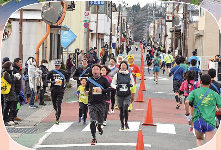
広野町《ふる里ふれあいマラソン》