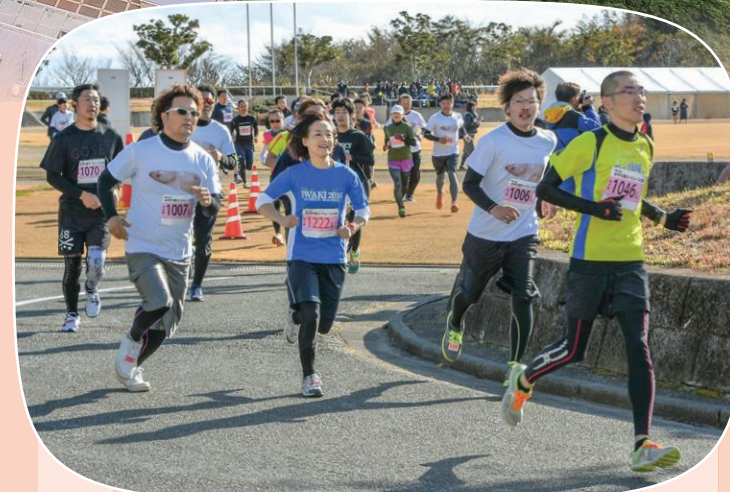
楡葉町《ゆずの里ロードレース大会》