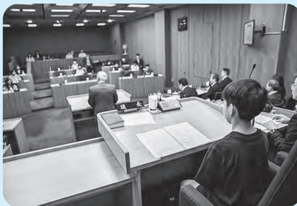
子ども議長の進行により議会が進められます