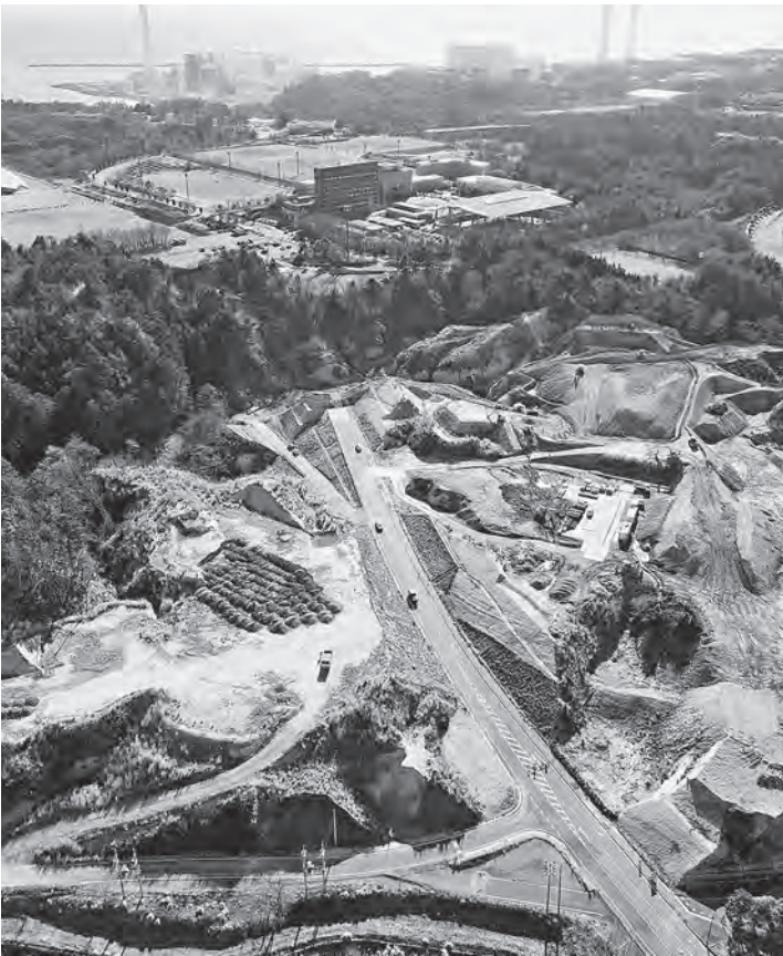
整備が進む多機能拠点