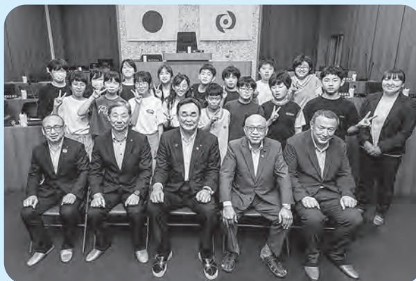
子ども議員と関係者との記念写真