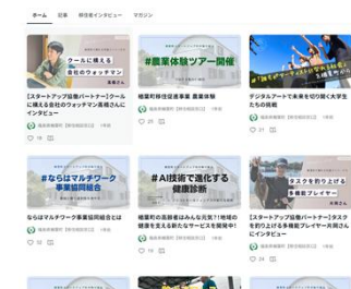
▲移住者インタビューなどのnote記事