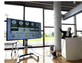
▲地方人材を増やす取り組みのプレゼン