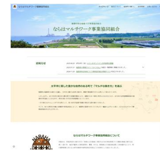
▲制作したならはマルチワーク事業協同組合HP