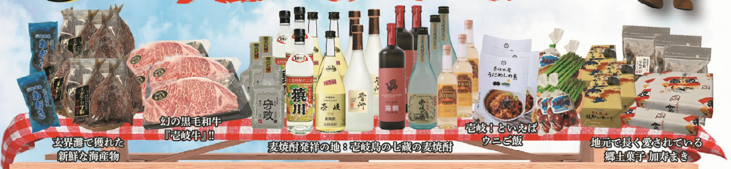
玄界灘で獲れた 新鮮な海産物