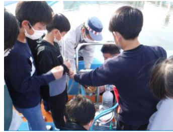
フールの水をろ過して飲料水に