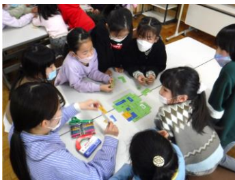
防災リュックに何を入れる?