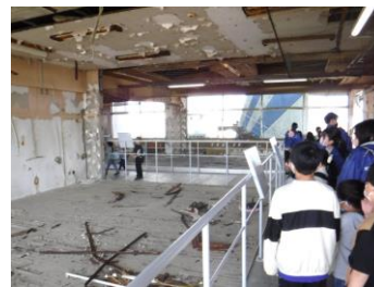
旧請戸小で津波の脅威を実感