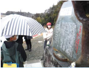
町内の震災遺構を巡って

今年からスタートした 3.11 に関する伝承と防災活動。小学校の総合的な学習の時間では地域の震災遺構を見学し、放課後には消防団の皆さんなど地域団体の方々との防災に関する体験学習を深め、3月11日に子どもたちが町民の皆さんの前で発表しました。 今年度は他地域での活動も実施することで、さらに体験や学びを深める予定。 7月には津波の被害が大きかった陸前高田で、防災をテーマとした小学校上学年対象の宿泊体験を実施し、地元の子どもたちと共に防災マップをもとに防災ウォッチングをします。9月には全国の防災団体が横浜に集まる「防災国体」に榊葉の子ども代表が初めて参加し、防災に関する交流を深めます。他地域で得た学びや体験も今年の3.11で発表する予定です。