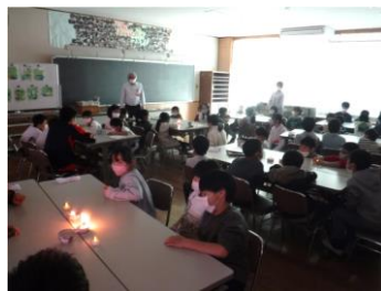
もしも電気が止まったら...