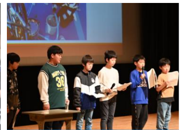
学んだことを町民に発表