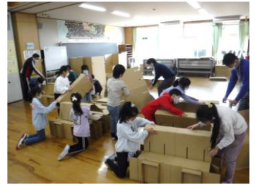
段ボールベッドを組み立てよう