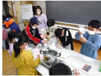
ビニル袋で非常食クッキング!