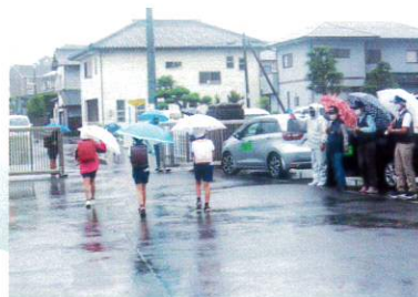
佳作 岡村 勝さん(静岡県)