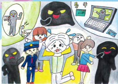
佳作 齋丸 結衣さん(福島県)