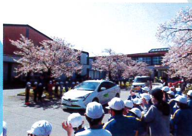
最優秀 高橋 祐仁さん(山形県)