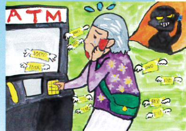
佳作 平島 優作さん(徳島県)