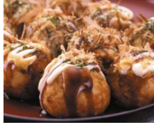
道頓堀くくるのたこ焼や焼き芋の振舞いも！