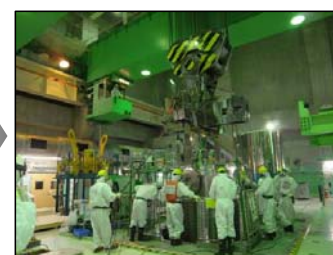
⑨共用プールでのキャスク移動