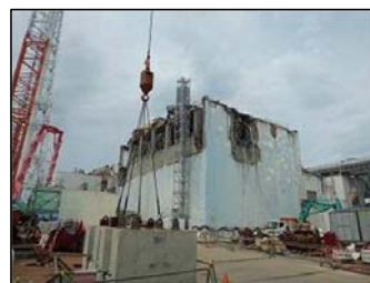
②原子炉建屋ガレキ撤去作業後