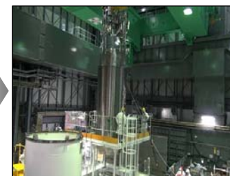
⑦4号機におけるキャスク移動