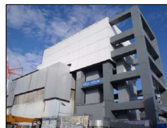
④燃料取り出し用カバー完成