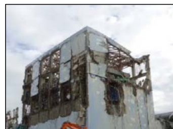
①原子炉建屋ガレキ撤去作業前