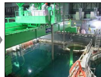
⑥使用済燃料プールからの燃料取り出し