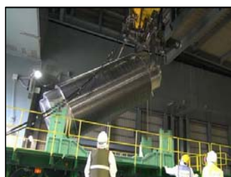
⑧トレーラーへのキャスク積み込み