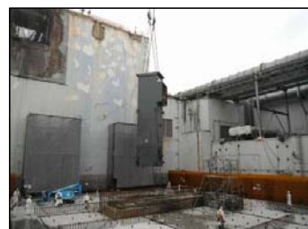
③燃料取り出し用カバー工事着手