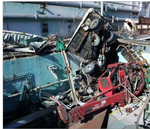
4号機タービン建屋前