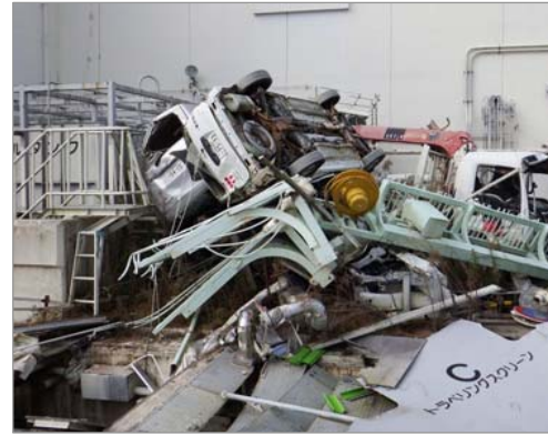
1号機タービン建屋前