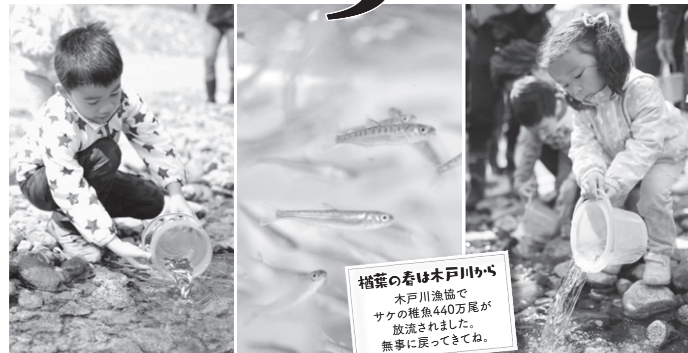
檜葉の春は木戸川から 木戸川漁協で サケの稚魚440万尾が 放流されました。 無事に戻ってきてね。