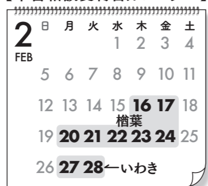
【申告相談受付日カレンダー】