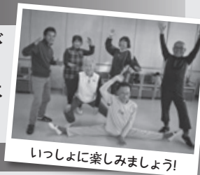
いっしょに楽しみましょう!

ゆっくりな動作でも、体幹を鍛え、転びにくい体を作ることができる太極拳! いわき教室は3月で終了し、4月からは檜葉町でのみ、月2回の開講となります。