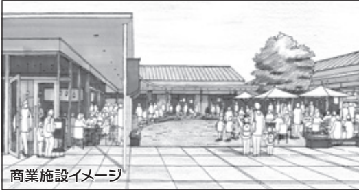
商業施設イメージ