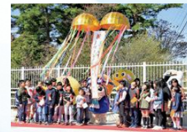
Jヴィレッジ駅キックオフ