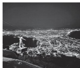
世界三大夜景「函館の街」

町制施行70周年記念事業として運行する今年度の第18回町民号は、本州を離れ、北海道道南・道央地方をめぐる2泊3日の旅です。