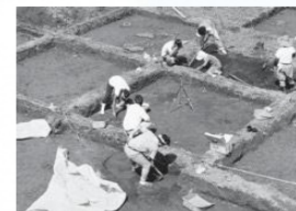
天神原遺跡の発掘調査