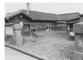
合併当時の飯庁舎 (旧龍田村役場)