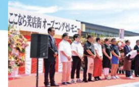
ここなら笑店街オープニングセレモニー