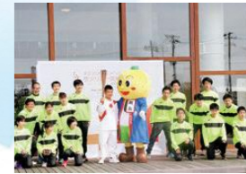
東京2020オリンピック聖火リレー