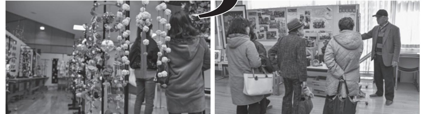
住民の皆さんの心のこもった手作り作品が一堂に会した檜葉まなび館。連日大勢の方が鑑賞に詰めかけました。(3/1～11)