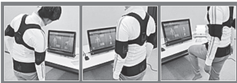
姿勢や動作を分析!