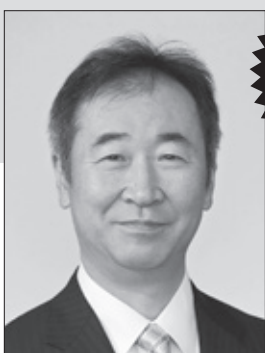
東京大学宇宙線研究所所長 梶田 隆章 氏