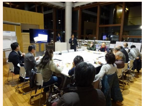
写真：第4回ワークショップの様子

今回のグループワークでは、住民が主体となって「これからの賑わいづくりのためにできること」について意見を出し合いました。