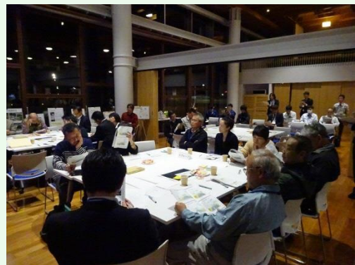
写真：ワークショップの様子