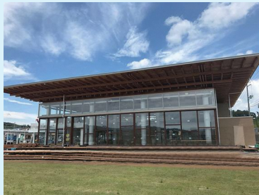
芝生から眺めるライブは最高に気持ちいい!!