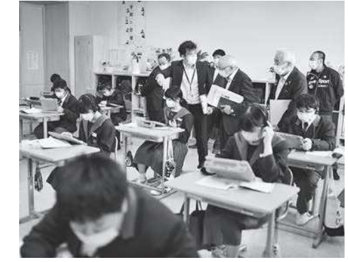
タブレットを使った授業

制作をする。 4 まとめ 「教育の充実」を目指し町の教育は進められている。来年度から小学校がわかることで、現在よりも小中学校の物理的な距離が出来てしまうが、今後も小中学校が密接に連携できるように、また魅力ある学校教育がなされるよう、学校間はもちろんのこと、保護者ともコミュニケーションを図りながら、子ども達のためによりよい学校運営に努めて欲しい旨、要望を行った。