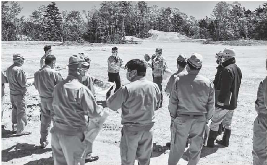
施設整備予定地の説明を受ける

また、近年多発している自然災害に対応した施設として防災倉庫の整備が望まれているところであり、現在町内数箇所に分散管理している資機材を一括管