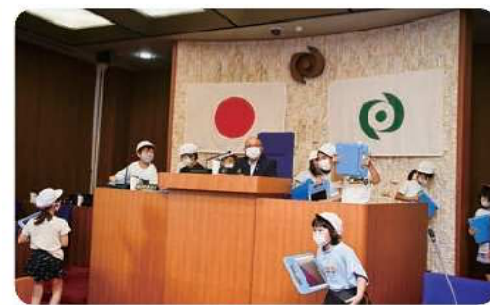
ところ狭しと見学が行われました